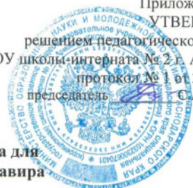
Таблица-сетка часов учебного плана для ГКОУ школы-интерната № 2 г. Армавира на 2022-2023 учебный год (II вида II отделение (вариант I) для обучающихся 8 – 10 классов