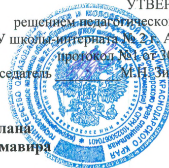
Таблица-сетка часов учебного плана ГКОУ школы-интерната № 2 г. Армавира на 2023-2024 учебный год АООП НОО вариант 1.4