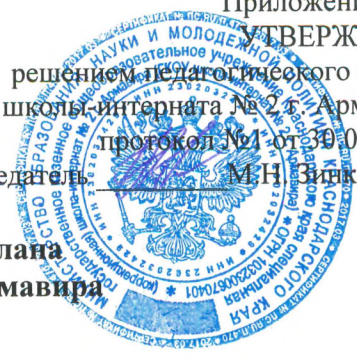
Таблица-сетка часов учебного плана ГКОУ школы-интерната № 2 г. Армавира на 2023-2024 учебный год АООП НОО вариант 1.3