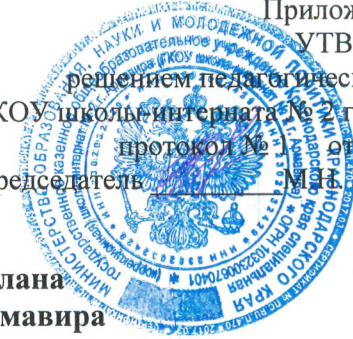
Таблица-сетка часов учебного плана ГКОУ школы-интерната № 2 г. Армавира на 2023-2024 учебный год АООП СОО для слабослышащих и позднооглохших обучающихся II вид II отделение (вариант 1)