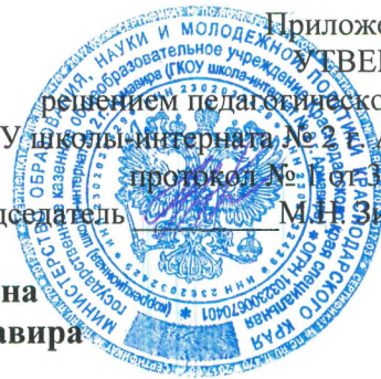
Таблица-сетка часов учебного плана ГКОУ школы-интерната № 2 г. Армавира на 2023-2024 учебный год АООП ООО (II вида II отделения (вариант 1) для обучающихся 9 – 10 классов