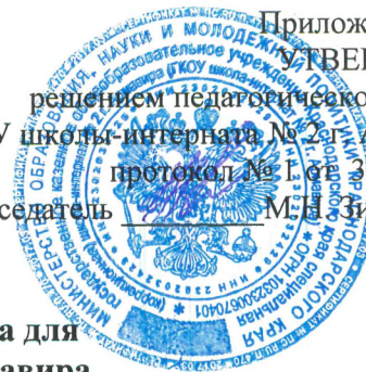
Таблица-сетка часов учебного плана для ГКОУ школы-интерната № 2 г. Армавира на 2023-2024 учебный год АООП ООО I вида (вариант 2) для обучающихся 9-10 классов