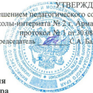
Таблица-сетка часов учебного плана для ГКОУ школы-интерната № 2 г. Армавира на 2022-2023 учебный год I вида (вариант 2) для обучающихся 8-9 классов